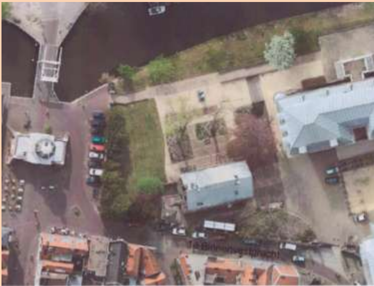
Morspoortplein / Singelpark