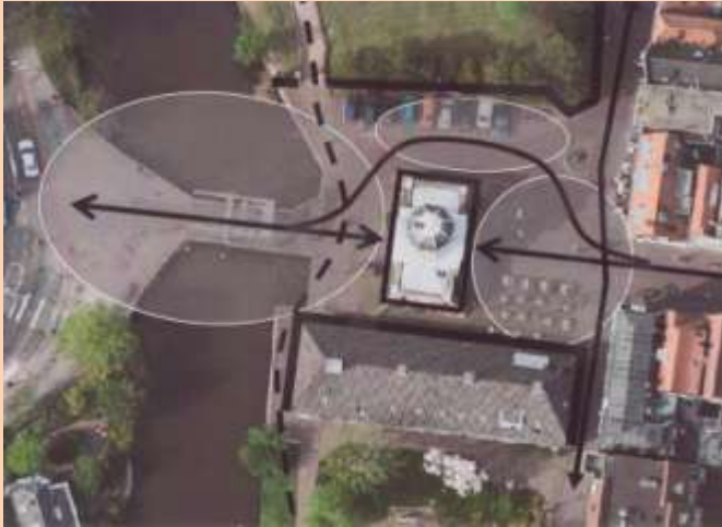
Singelpark route, fiets route en de aanloop route binnenstad.