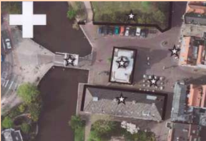
Plus punten: Morspoortburg, Morspoort, Wachtgebouw, museum tuin en terrassen.